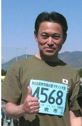
桃の里マラソンに参加(4月)

〒406-0046 山梨県笛吹市石和町東油川172 電話:055-262-3357 FAX:055-262-3409 E-mail:info@shimuranaoki.com